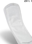
art nr 3537