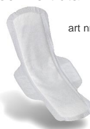
art nr 3536